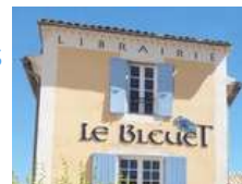
@Librairie Le Bleuet