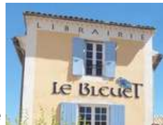
@Librairie Le Bleuet