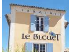
@Librairie Le Bleuet