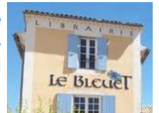
@Librairie Le Bleuet