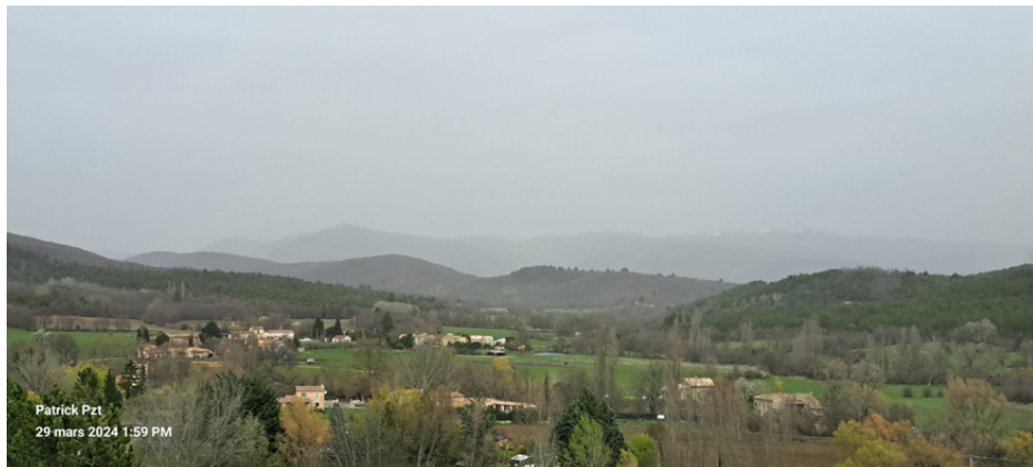
Vue du village un jour pluvieux de mars 2024

Ce bulletin est le vôtre, n'hésitez pas à nous proposer des articles ou des sujets à aborder. Pour cela, vous pouvez nous écrire sur l'adresse : communication@revestdesbrousses.org